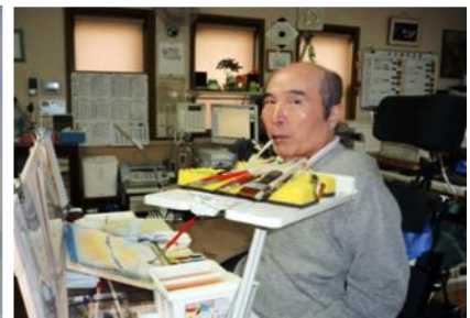
重度後遺障害者の作品創作の様子