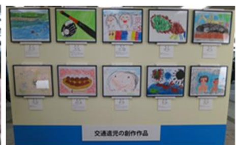
昨年の「ナスバギャラリー IN 東京」の様子