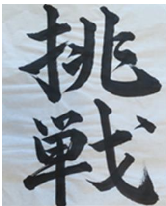
28年度交通遺児友の会書道コンテスト 最優秀賞(国土交通大臣賞)

この「ナスバギャラリー IN 東京」は、交通遺児等のコンテスト入賞の書道作品や重度後遺障害者の方々による創作作品等の展示を通して、自動車事故被害者の現況を知って頂き、同様の被害者を発生させはならないという事故防止の意識の醸成を図るとともに、ナスバが行う被害者援護業務のPRと自賠責保険の確実な加入を促すための広報・啓発活動を併せて行うこととしています。是非お立ち寄り、ご高覧下さい。